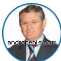
Dr. Moncada 🇪🇸 🇺🇸

Najbardziej dotknięta problemem wielkości penisa jest azjatycka grupa męskiej populacji. Rzeczywista średnia wielkość męskiego penisa azjaty to tylko ok. 10 cm. Od czasu seksualnego wyzwolenia w Azji jest dostępny Andropenis. To w tej chwili najbezpieczniejsze i najskuteczniejsze urządzenie powiększające penis pozwalające rozwiązać wiele problemów związanych z męską seksualnością.